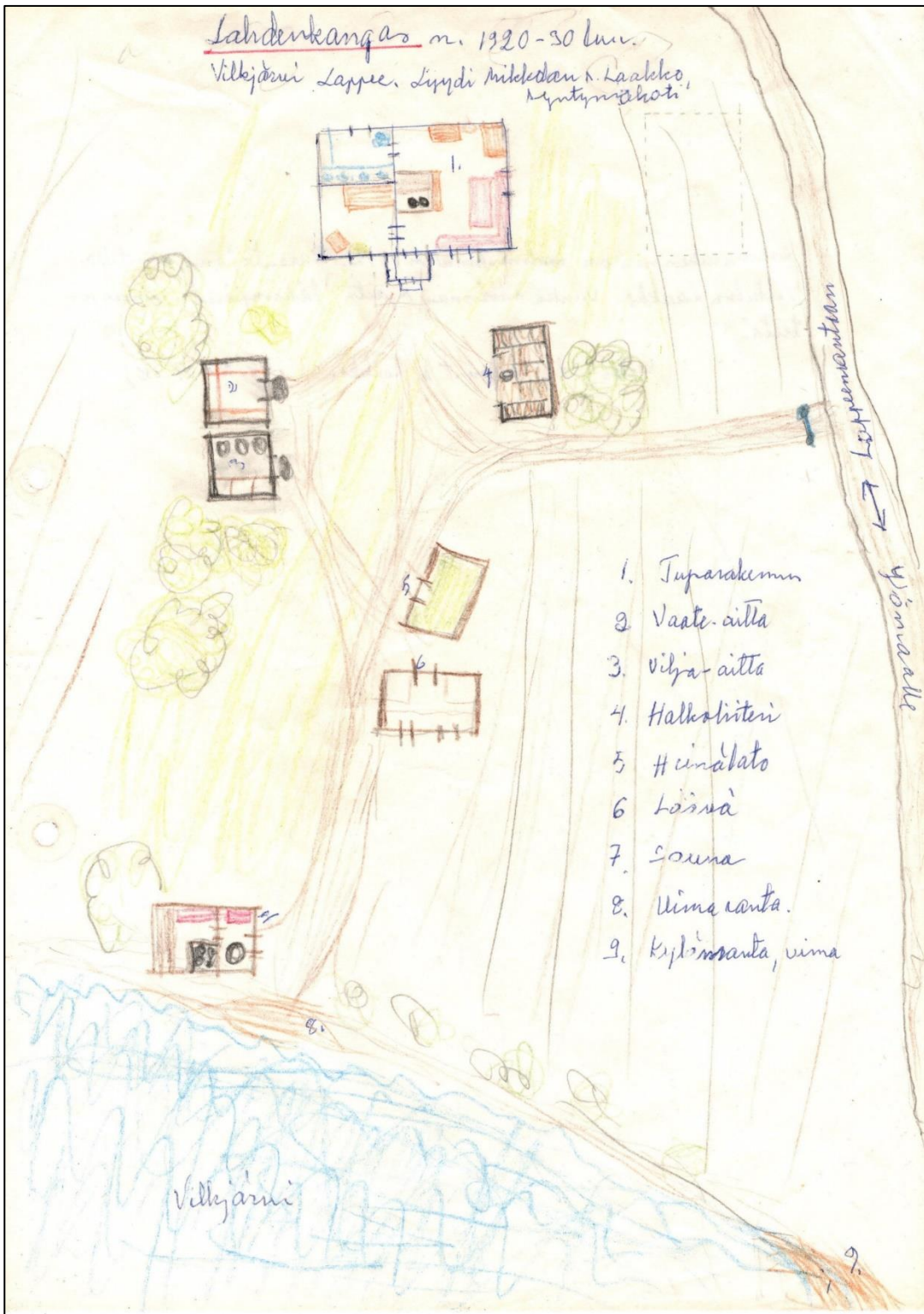
Lahdenkankaan pihapiiri 1920 -luvulla, piirros Elna Koski 1938